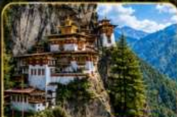
วัดทักซิง (Tiger's Nest)