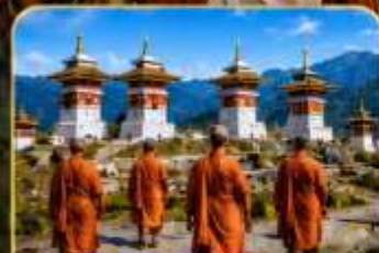
โดจุลาพาส (Dochula Pass)