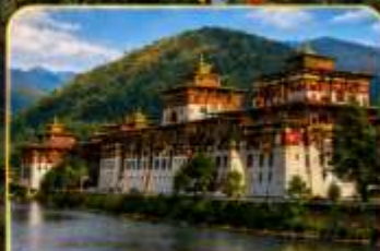
พูนาคาซอง (Punakha Dzong)