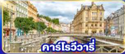
คาร์โรวีวาร์