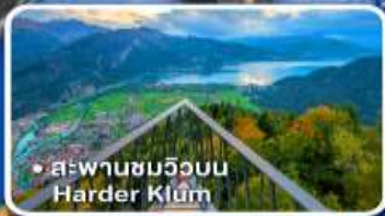
• สะพานชมวิวยิบ Harder Klamm