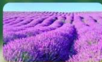
ทุ่งลาเวนเดอร์