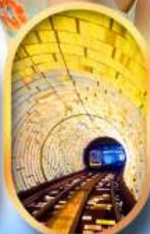
อุโมงค์แม่เหล็ก