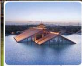
พิพิธภัณฑ์ไต้หน้ำ กวงฟูหลิน