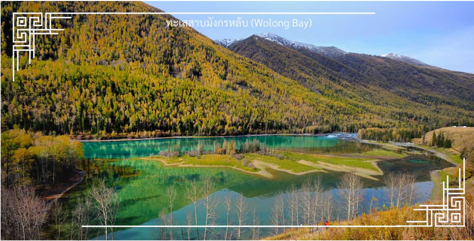
ทะเลสาบมังกรหลับ (Wolong Bay)

จากนั้นนำท่านชม ทะเลสาบเทวดา (Fairy Bay) จุดชมวิวยุคใหม่ที่ตั้งอยู่ทางตอนใต้ของทะเลสาบคานาสีอ ภายในเขตโดดเด่นด้วยผืนน้ำใสสะท้อนเงาภูเขาและผืนป่า สร้างบรรยากาศราวดินแดนในเทพนิยาย สถานที่แห่งนี้มีชื่อเรียกตามตำนานท้องถิ่นว่า “อ่าวของเหล่าเซียน” โดยเล่าขานกันว่าเป็นสถานที่ที่เหล่าเทพเซียนลงมาเล่นน้ำ จึงยิ่งเพิ่มเสน่ห์และความลึกลับให้กับทัศนียภาพอันงดงาม