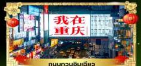
ถนนทวงฉิมเฉียว