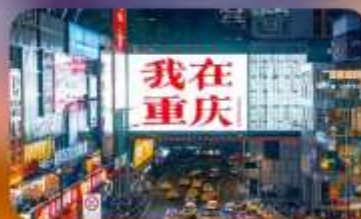
ถนนกวนอิมเฉียว