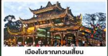
เมืองโบราณทวนเสียน