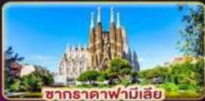
ซากradaฟามีเลีย