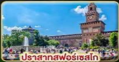
ปราสาทฟอรัลโก

📅 เดินทาง : 28 พ.ค. - 06 มิ.ย. | 05-14 ส.ค. 15-24 ต.ค. 69