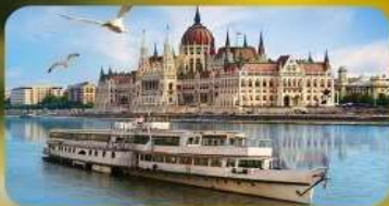
ล่องเรือแม่น้ำดานูบ พร้อมจิบแชมเปญ