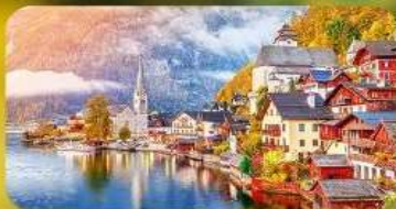
การ์นต์พัก Hallstatt / St. Wolfgang หรือริมทะเลสาบ 1 คืน