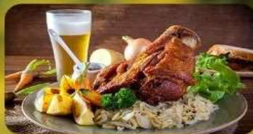
พิเศษ! ลิ้มลองเมนูประจำชาติ ทั้ง 5 ประเทศ!!!