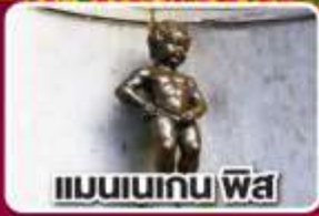
แมนเนเกน พิส