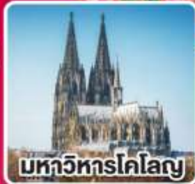
มหาวิหารโคโลญ

เที่ยวเก็บครบ เบเนลักซ์ เบลเยียม เนเธอร์แลนด์ และลักเซมเบิร์ก