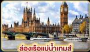
ล่องเรือแม่น้ำเทมส์