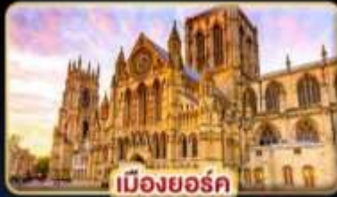
เมืองยอร์ก