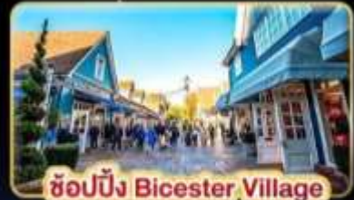
ช้อปปิ้ง Bicester Village