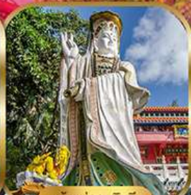
เจ้าแม่กวนอิม พลัสเบย์