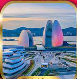
Zhuhai Opera House