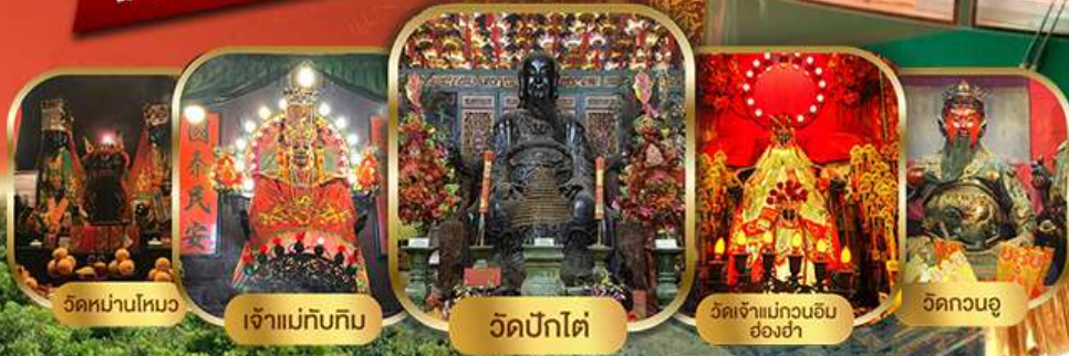
วัดหน้าม่านโคม

ไหว้พระเสริมดวงแบบจัดเต็ม รวมขึ้นพีคแกรม