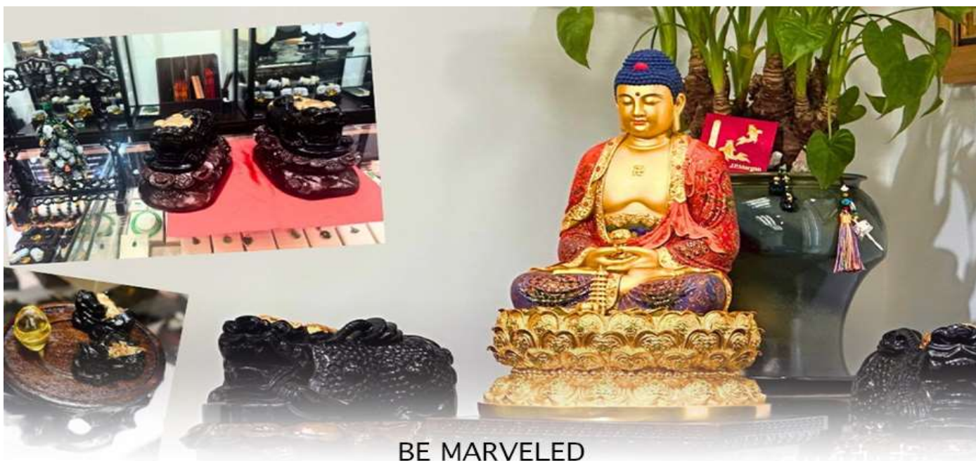
BE MARVELED ศูนย์ปี่เซ่ยะ