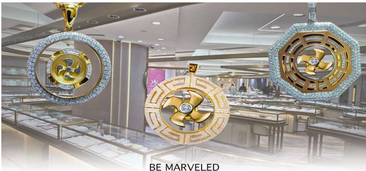
BE MARVELED ศูนย์ฮวงจุ้ย กั๊กหันเศรษฐี

ความเชื่อว่าหยก มงคล ถ้าพกติดตัวไว้จะอายุยืนและสุขภาพดีมีสินค้ามากมายเกี่ยวกับหยก อาทิ กำไลหยก หรือสัตว์นำโชค อย่างปี่เซ่ยะ ให้ท่านได้เลือกซื้อเป็นของฝาก, ของที่ระลึก หรือของนำโชคแต่ตัวท่านเอง