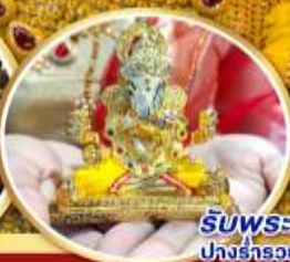
รับพระพิฆเนศวร ปางรำรอยทานละ 1 องค์