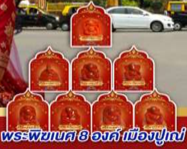
พระพิฆเนศ 8 องค์ เมืองปูเน่