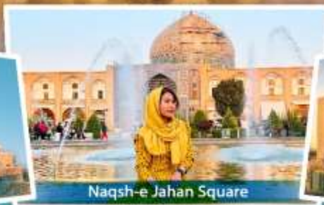
Naqsh-e Jahan Square