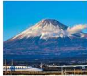
นั่งชินคันเซนชมฟูจิ