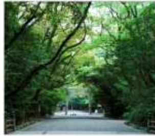
ศาลเจ้าอัสึตะ