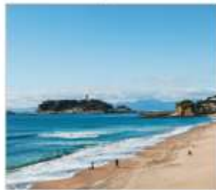
เกาะเอโนชิมะ