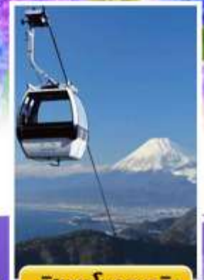
อิซุพานอรามาวิว

ออนเซ็น 1 คั้น นน.กระเป๋า 23 กก. 7Days 4Night