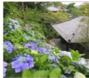
วัดฮาเซเดระ(เดรนเยีย)