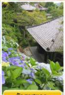
วัดฮาเซเดระ