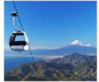
อิซุพานอรามาวิว