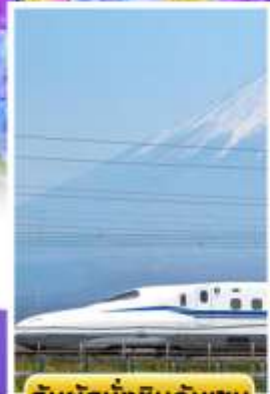
สัมปั่งชินคันเซน