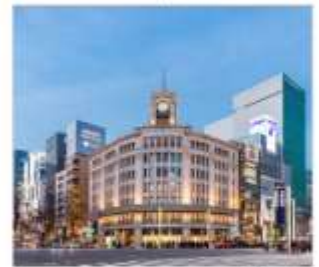
กินซ่าช้อปปิ้ง