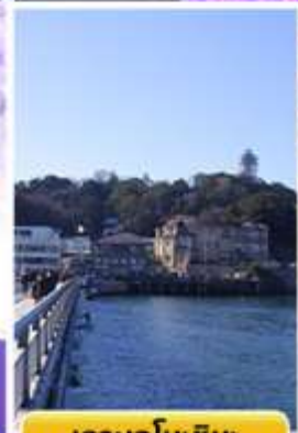
เกาะเอนะชิมะ