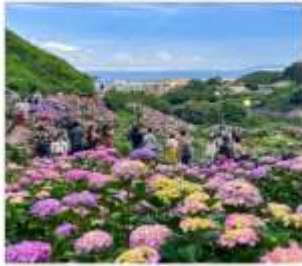
เทศกาลดอกไฮเดรนเยีย