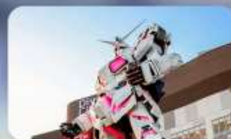
ช้อปปิงโอไดบะ