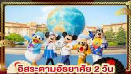
อิสระตามอริยาศัย 2 วัน