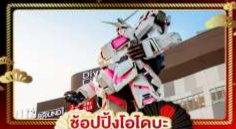
ช้อปปิ้งโอไดบะ