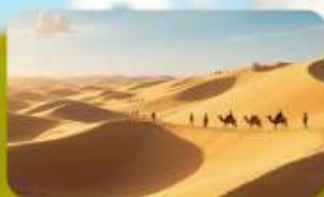
เนินทรายอินเคินทาลา