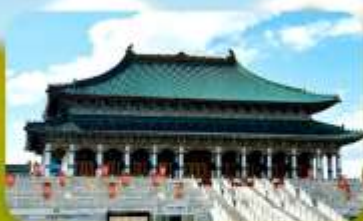
พระราชวังต้องห้ามออร์ดอส