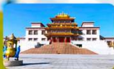
คฤหาสน์พุทธบูชาแห่งชีวิตอุทยาน