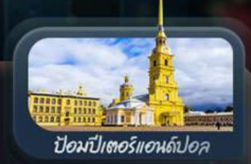
ป้อมปีเตอร์แอนด์ปอล

highlight สองเมืองไฮไลท์ของรัสเซียที่ไม่ควรพลาด! ตื่นตาตื่นใจกับมหาวิหารเซนต์บาซิล ชมความยิ่งใหญ่ของจัตุรัสแดง สัมผัสอดีตที่พระราชวังเครมลิน ชมความงามของสถานีรถไฟใต้ดินมอสโก ชาร์กอร์ส โบสถ์ไอสิกรีนดี เป็นเขาสเปร์โรวให้คุณได้สัมผัส ชมความงามพระราชวังฤดูหนาว พิพิธภัณฑ์ฮอร์มิงทง ป้อมปีเตอร์แอนด์ปอล และมหาวิหารเซนต์ไอแซค