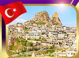
หุบเขาอูชิซาร์ คัปปาโดเกีย