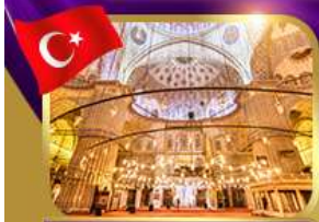
เข้าชมความงามสุเหร่าสีน้ำเงิน