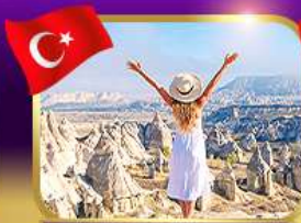
ชมความงาม หุบเขาแห่งรัก