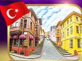
ชมบ้านหลากสีย่านบาลัก