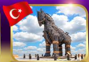
ม้าไม้เมืองทรอย ซานิคคาลั