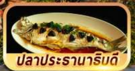
ปลาประรานาโรบิตี