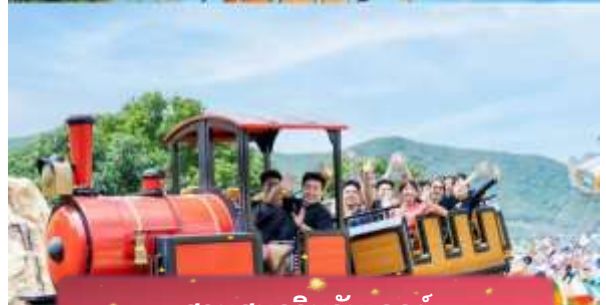
สวนสนุกวินวันเดอร์