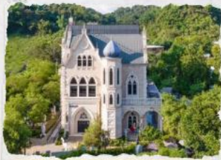
ปราสาทซ็อคโกแลต