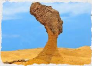
อุทยานเขาสีลิว