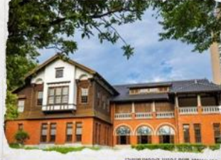
พิพิธภัณฑชาติน้ำพุร้อน