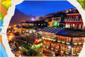
หมู่บ้านโบราณฉิวเฟิง