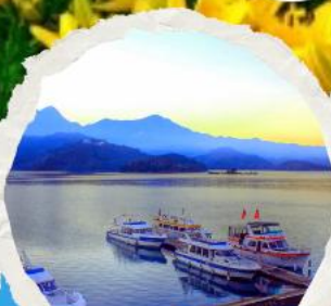
ทะเลสาบสุริยขึ้นจินทารา