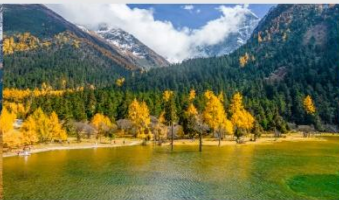
อุทยานแห่งชาติปี่เฟิงโกว