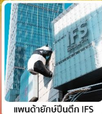
แพนด้ายักษ์ปิ่นตึก IFS