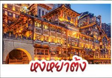
ตงเซาตัง