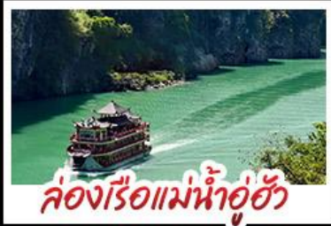
ล่องเรือแม่น้ำอู๋ฮัว

ฉงชิ่ง - อุ๋หลง - ฉีเยินเจียง หลุมฟ้าสามสะพานสวรรค์ - หงหยาดัง พุทธศิลป์ต้าจู๋ - ล่องเรือแม่น้ำอู๋ฮัว