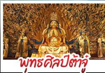
พุทธศิลป์ต้าจู๋