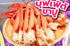
บุฟเฟ่ต์ ภูเขา