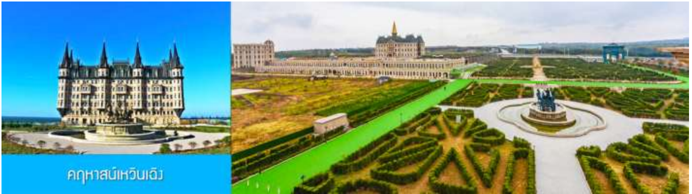
คฤหาสน์เหวินเจิง

จนได้เวลาอันสมควรนำท่านเดินทางสู่ คฤหาสน์เหวินเจิง 文成城堡 คฤหาสน์สไตล์ยุโรป ที่ตั้งตระหง่านอยู่ริมทะเลในเมืองเยินไถ ที่นี่ไม่ใช่แค่สถาปัตยกรรม แต่คือ ประตูลูกโลกแห่งจินตนาการที่ท่านจะได้สัมผัสความหรูหรา และได้สัมผัสกับสถาปัตยกรรมสไตล์บารอกที่ยิ่งใหญ่ เหมือน หลุดเข้าไปในเทพนิยายของยุโรป ให้ท่านเก็บภาพบรรยากาศตามอัธยาศัย จนได้เวลาอันสมควร นำท่านเดินทางสู่ภัตตาคาร