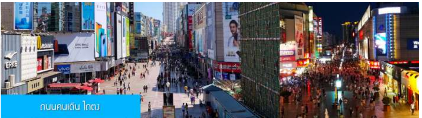
ถนนคนเดิน ไถตง

จากนั้นนำท่านเที่ยวชม โรงเบียร์ชิงเต่า 青岛啤酒博物馆 พิพิธภัณฑ์เบียร์ที่ขึ้นชื่อของเมืองชิงเต่า ซึ่งเป็นเบียร์ยี่ห้อแรกที่ผลิตขึ้นในประเทศจีน ชมเบียร์ คอลเลกชันที่มียี่ห้อหลากหลายที่สุดของโลก และชมการจัดแสดงภาพและวิดิทัศน์เกี่ยวกับวิวัฒนาการของเบียร์ ขั้นตอนการผลิตและอื่น ๆ ที่เกี่ยวข้อง พร้อมชิมเบียร์ชิงเต่า ซึ่งเป็นเบียร์ที่ขายดีที่สุดในยี่ห้อหนึ่งของจีน.. (ชิมเบียร์ชิงเต่าท่านละ 1 แก้ว รับประทานอีก 1 ขวดเล็ก ตอนเดินออก)