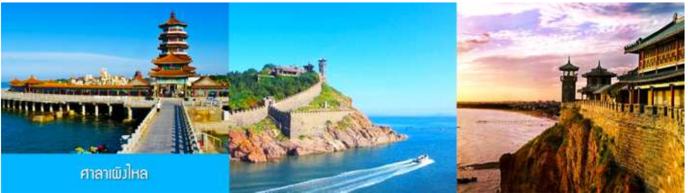
ศาลาเพิ่มไหหล

จนได้เวลาอันสมควรนำท่านเดินทางสู่ คฤหาสน์เหวินเจิง 文成城堡 คฤหาสน์สไตล์ยุโรป ที่ตั้งตระหง่านอยู่ริมทะเลในเมืองเยินไถ ที่นี่ไม่ใช่แค่สถาปัตยกรรม แต่คือ ประตูลูกโลกแห่งจินตนาการที่ท่านจะได้สัมผัสความหรูหรา และได้สัมผัสกับสถาปัตยกรรมสไตล์บารอกที่ยิ่งใหญ่ เหมือน หลุดเข้าไปในเทพนิยายของยุโรป ให้ท่านเก็บภาพบรรยากาศตามอัธยาศัย จนได้เวลาอันสมควร นำท่านเดินทางสู่ภัตตาคาร