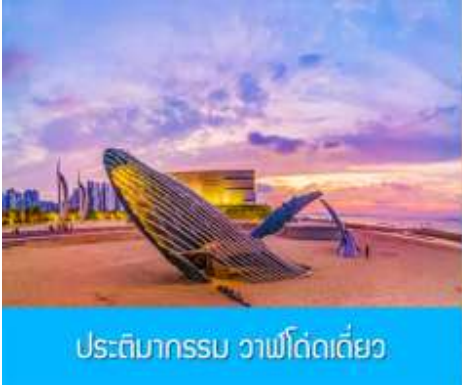
ประติมากรรม วาฬโดคเด็ยว