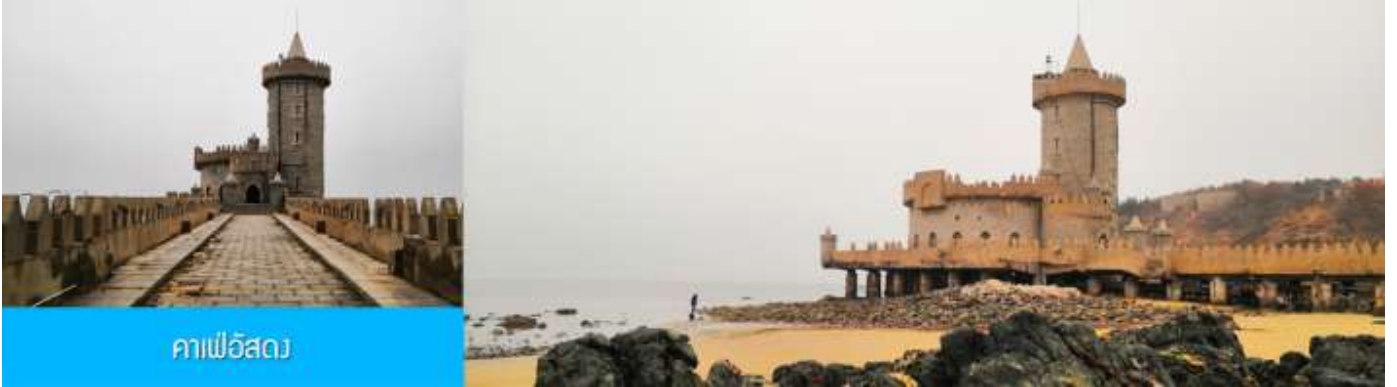
กาแฟอีสต

จากนั้นนำท่าน เดินทางสู่ กาแฟอีสต นำท่านชมปราสาทในเทพนิยาย ที่ตั้งตระหง่านอยู่ริมชายหาดนานาชาติ เว่ยไห่ กาแฟที่ออกแบบด้วยสถาปัตยกรรมสไตล์ยุโรป ตัดกับวิวทะเลสีคราม และที่นี่คือแม่เหล็กดึงดูดนักท่องเที่ยวมาเก็บบรรยากาศความสวยงามความโรแมนติก (ตัวปราสาทเป็นร้านกาแฟ หากท่านต้องการเข้าไปด้านใน ต้องจ่ายค่าเครื่องดื่ม ตามเมนูทางร้าน ไม่รวมในอัตราค่าทัวร์)