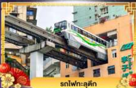
รถไฟฟ้า-ลูตัก