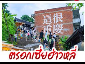
ตรอกซี่ยฮ่าวหลี่