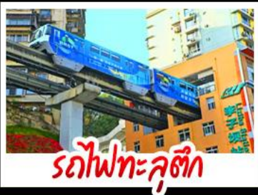
รถไฟทะลุติค