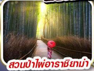
สวนป่าไฟอาราชิยาม่า