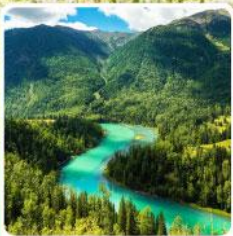
ทะเลสาบคานาสือ