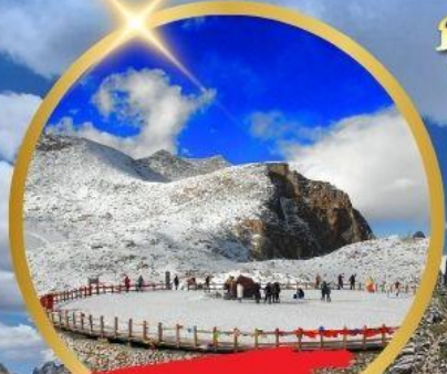
OPTIONAL TOUR ธารน้ำแข็งตากลุ่มบงชวน