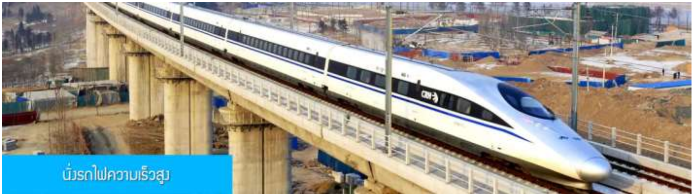
เมืองรถไฟความเร็วสูง

หลังอาหารนำท่านเดินทางสู่สถานีรถไฟความเร็วสูงนครซีอาน เพื่อเตรียมเดินทางสู่นครฉั่วหยาง