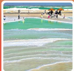
ทะเลสาบเกลือจาเอ้อหาน

ไฮไลท์! กำมั่วเกาดู กำพุทศศิลปะโบราณ มรดกโลก UNESCO ภูเขาสายรุ้งจางเย่ ภูเขาหินสีสั่นแปลกตา หนึ่งในภูมิประเทศที่แปลกที่สุดในโลก