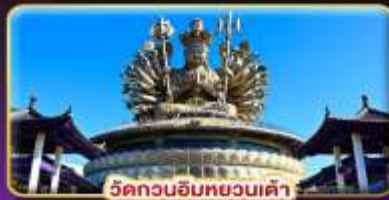
วัดกวนอิมทวอนเตา