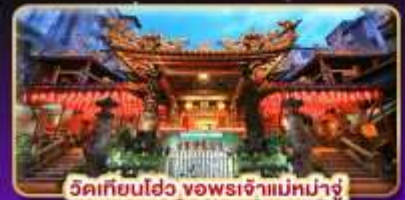
วัดเทียนเฮว จอพระเจ้าแม่มาจู่