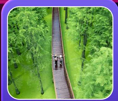
“ป่าสนชิงซาน”