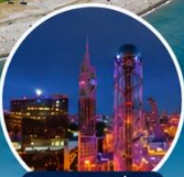
ชมแสงสียามค่ำคืนของเมืองบาตุมิ