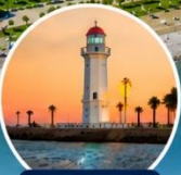
ประภาคารบาตุมิ สัญลักษณ์ของเมือง