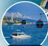
กระเช้าอาร์โก ชมวิวเมืองบาตุมิ