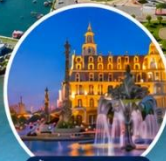
น้ำพุ The Neptune แห่งบาตุมิ