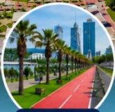
เดินเล่นริมทะเลบรรยากาศสุดชิล