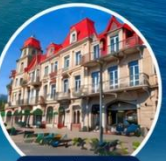
ย่านเมืองเก่าบรรยากาศยุโรป

☁️ การล่องเรือนั้นขึ้นอยู่กับสภาพอากาศ กรณีที่ไม่สามารถล่องเรือได้ ทางบริษัทขอสงวนสิทธิ์ปรับเปลี่ยนโปรแกรมตามความเหมาะสม