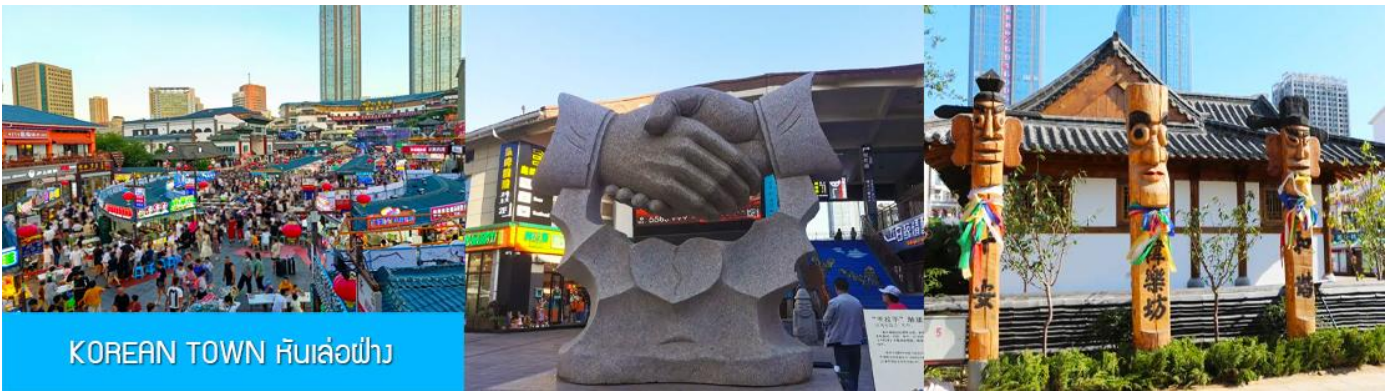
KOREAN TOWN หันเล่อฝาง