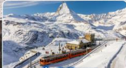
นั่งรถไฟสุดอลเวง กรอนเนอร์เกรต