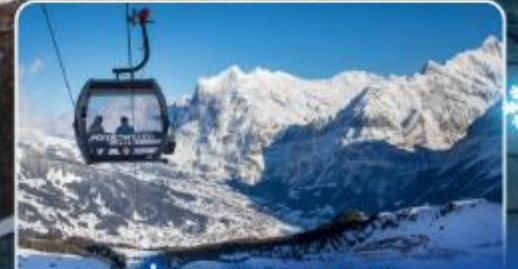
นั่งกระเช้าและรถไฟสุดอลเวง จุงเฟรา