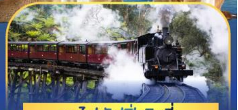
รถไฟพั้งบิลลี่

ล่องเรือชมอ่าวซิดนีย์พร้อมรับประทานอาหารกลางวัน และ เข้าชมสวนสัตว์การองก้า