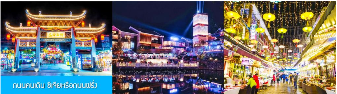
ถนนคนเดิน ซิเจียหรือถนนฝรั่ง