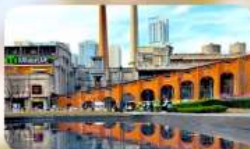
ตงเจียวจื่ออี้