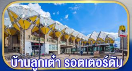
บ้านลูกเต่า รอตเตอร์ดัม

เยือนเมืองเก่าแก่ยุโรป ทั่วมหาสมุทรแอตแลนติก กับการบินไทย บินตรงอัมสเตอร์ดัม