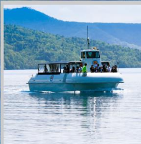
"LAKE SHIKOTSU GLASS BOAT"