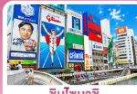
ชิบูยาชิ