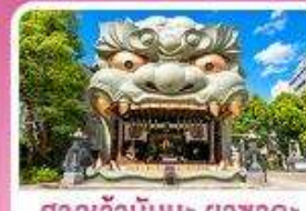
ศาลเจ้านัมมะ ยาชากะ