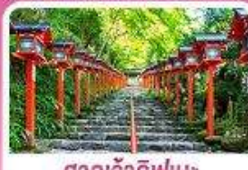
ศาลเจ้าคิฟูเนะ